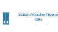
Asociación De Contadores Públicos Del Tolima-ASOCOLTA