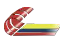
Colegio de Contadores Públicos de Bolívar